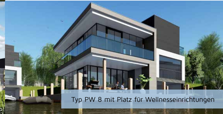
Typ PW 8 mit Platz für Wellnessseinrichtungen

Entdecken Sie alle Villen auf: www.harbourvillage.de