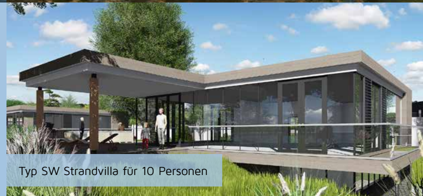
Typ SW Strandvilla für 10 Personen

Wetten, dass auch Sie sich in die Gewässer Zeelands im Allgemeinen und das Veerse Meer im Besonderen unsterblich verlieben werden?