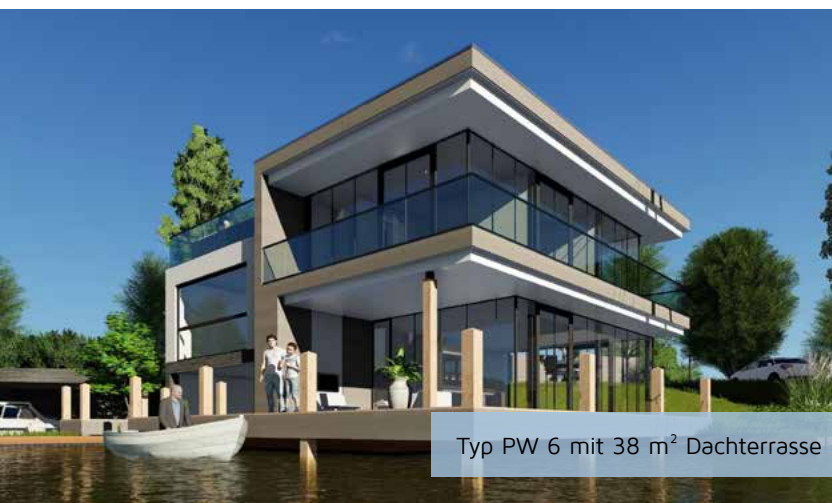
Typ PW 6 mit 38 m 2 Dachterrasse

Hier entsteht ein ultraluxuriöses Ferienresort mit den größten und exklusivsten Ferienvillen der ganzen Niederlande. Direkt am Wasser, jede Villa mit einem eigenen Bootshaus und Anlegesteg. In der wunderschönen Umgebung des Veerse Meer, der Perle Zeelands.